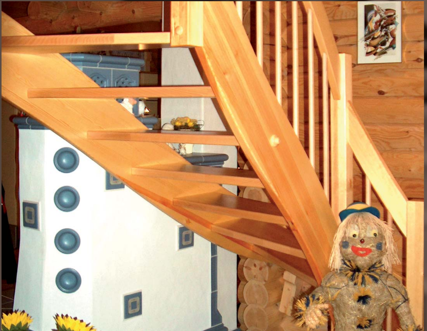
Beidseitige Wangentreppe in Kiefer mit Buchestufen, Höhenverstellung über Ausgleichsverbindungen (Gebrauchsmusterschutz). Brüstungsgeländer mit Estrichblende in Kiefer, Stufen mit Anti-Rutsch-Lackierung .