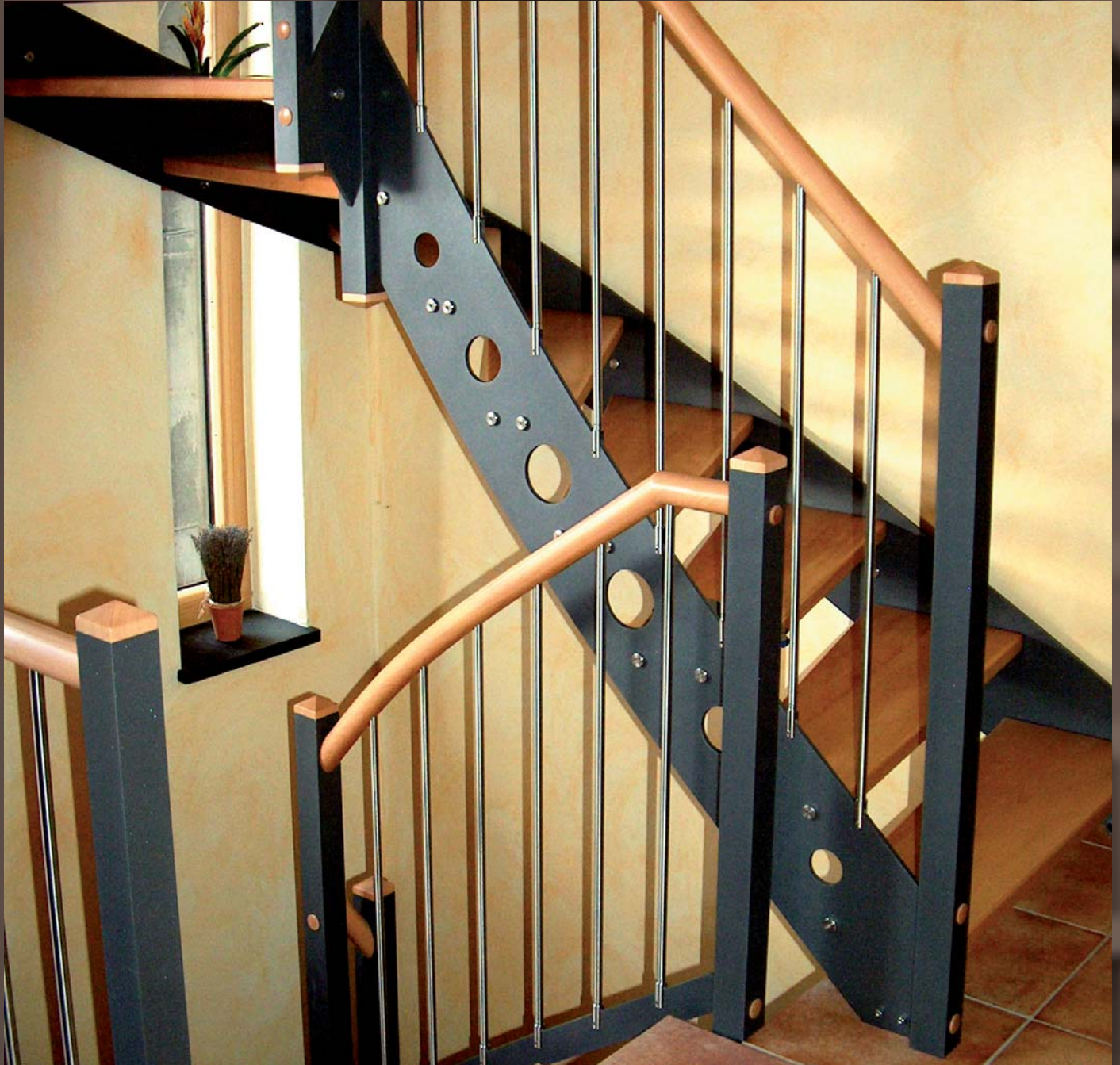
Duo-Line Aluwangen, pulverbeschichtet mit Buchestufen. Handlauf 50Ø rund. Innenwange mit Kreissegmenten.