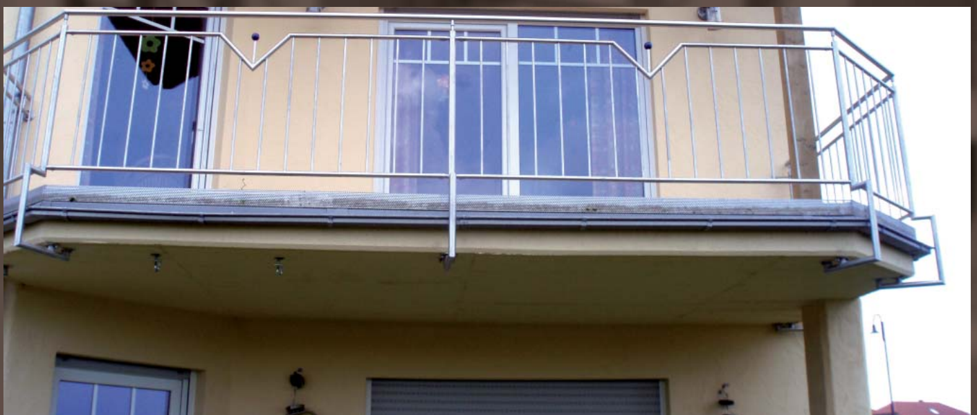
Unten: Edelstahlbalkon Modell : 3301 / front 3305 mit Sonderkugel in Blau.