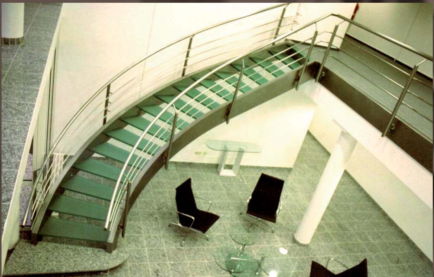
Stahlwange aus Rechteckrohr mit Relengeländer geschwungen.