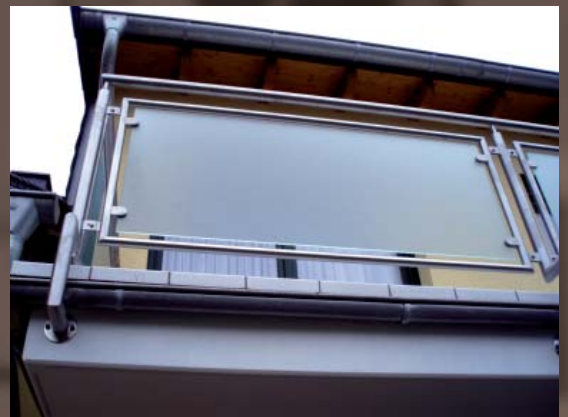
Rechts: Stirnseitige Befestigung.