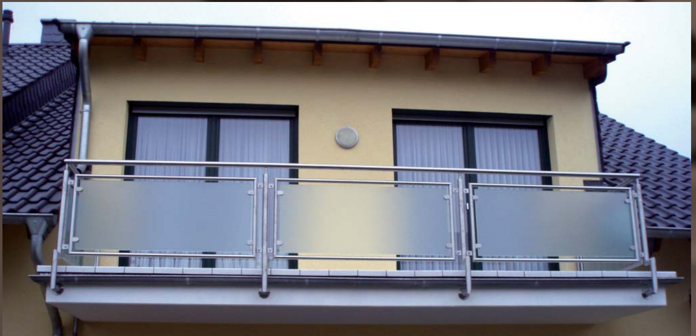
Oben: Edelstahlbalkon Modell 3301 mit Glasfüllungen (Milchglas VSG). Links: Befestigung von unten mit Rückgröpfung.