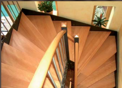
Alu-Pfosten mit Holzhut in Buche/Natur