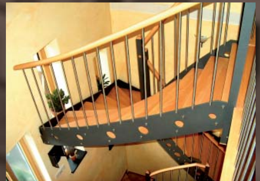
Aussengeländer mit Kreisbohrungen