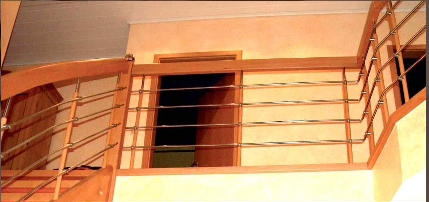
Relingeländer im Dachgeschoss

Eingestemme Wangentreppe in Buche gedämpft. Wangen-Handlaufkrümmung mit Relingeländer. Stufen mit Anti-Rutsch-Lack.