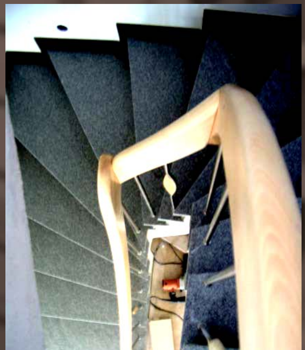
Steigungsgeländer auf Granitstufen in Buche hell Bogenstäbe Holz/Edelstahl (Geschmacksmusterschutz)