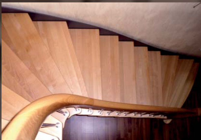
In Wendel mit Handlaufkrümmung