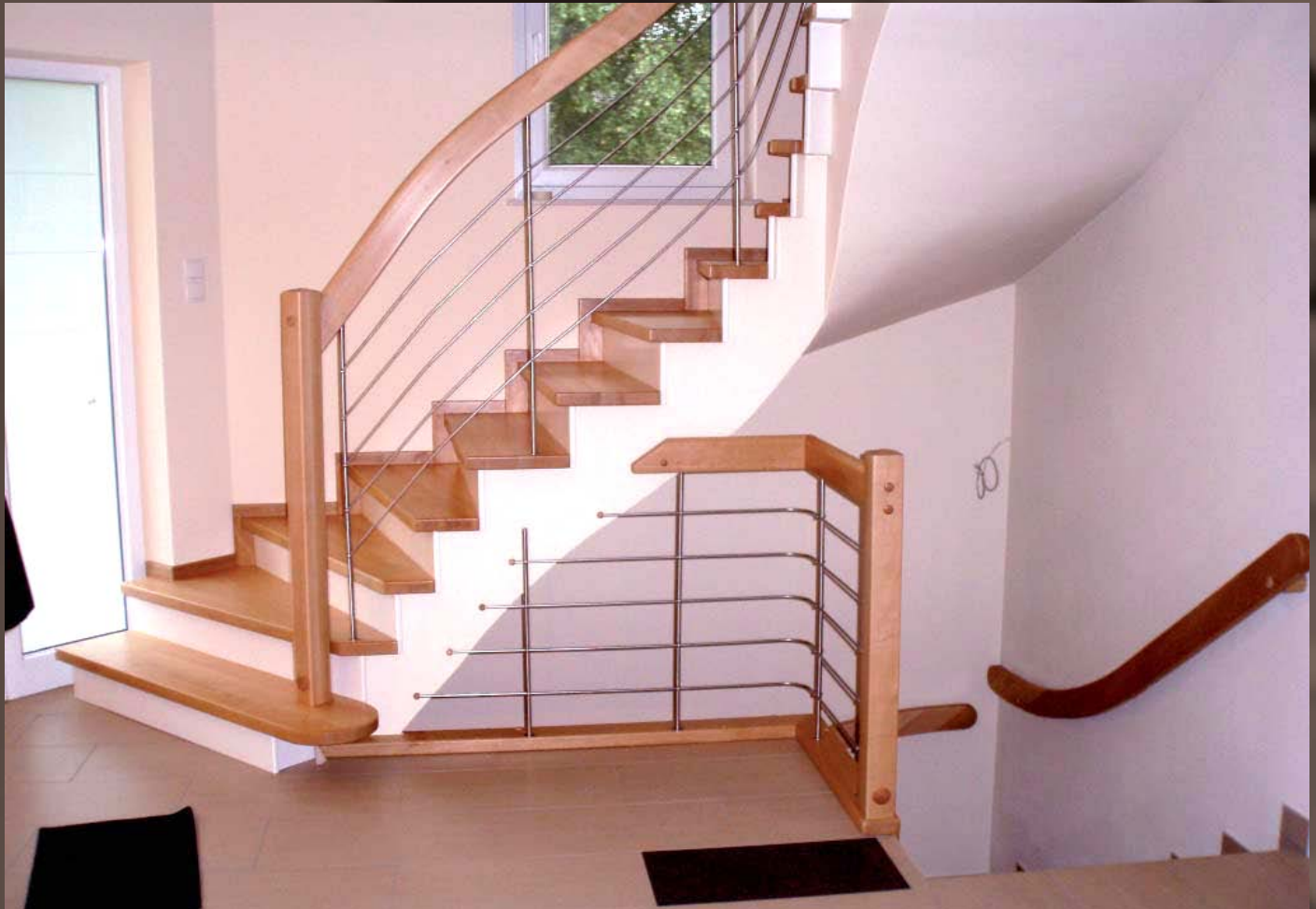
Stufen auf Beton, Buche Stufen mit Anti-Rutsch-Lack und Relinggeländer. Setzstufen weiß (RAL 9010) wandseitig mit Sockelleisten.