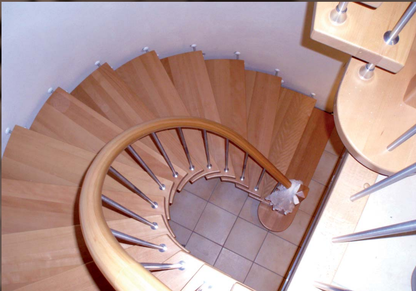
Wangenlose Tragbolzentreppe in Buche/Natur mit Sonderstäben (Geschmacksmusterschutz)