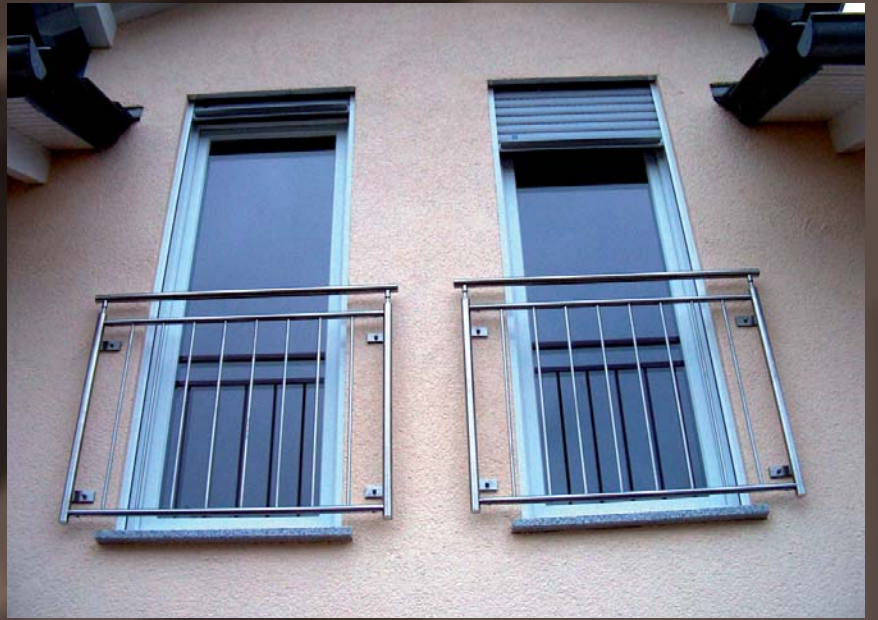
Französische Balkone in Edelstahl