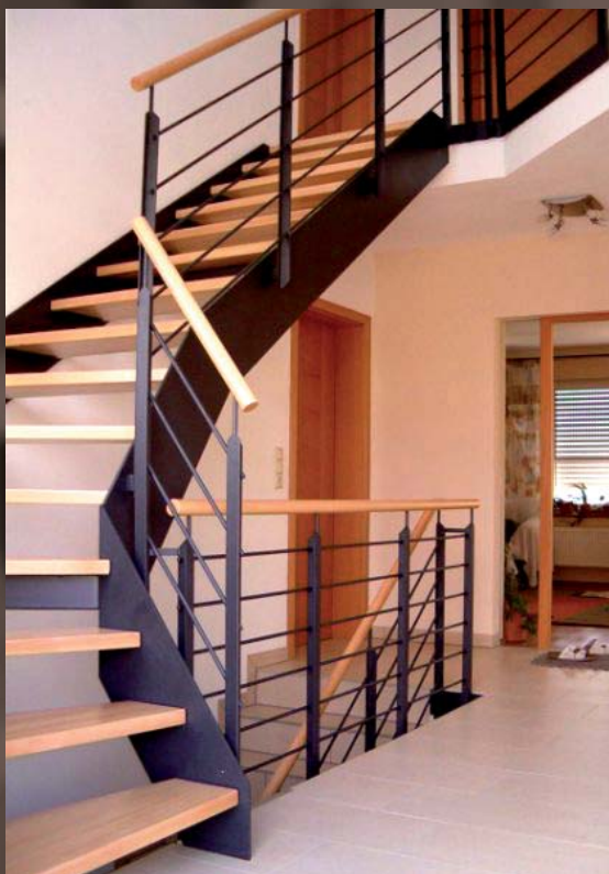
Flachstahlterpe mit zwei Wangen (gerade).