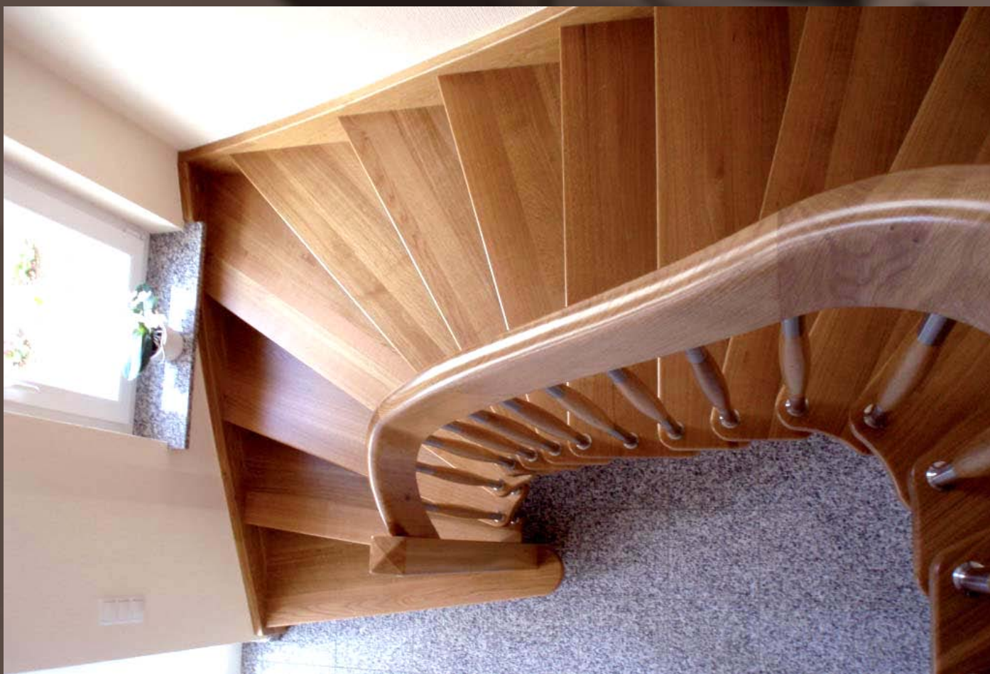
Wange Bolzentreppe mit Handlaufkrümmung, Blockstufe