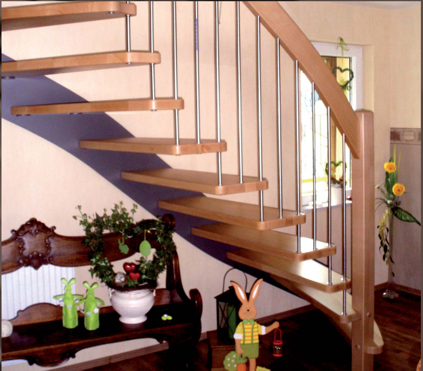
Komponenta - Die Flachstahl Bolzentreppe® in Buche/Natur mit geschwungener Stahlwange