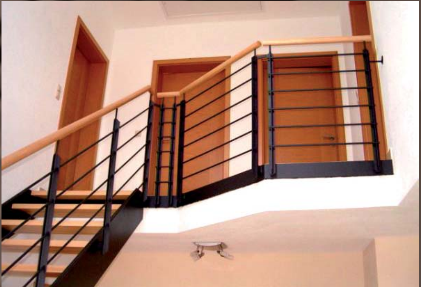
Dachgeschoss, Estrichblende mit Relingeländer. Pfosten als T-Pfosten. Holzhandlauf 40ø Rund.