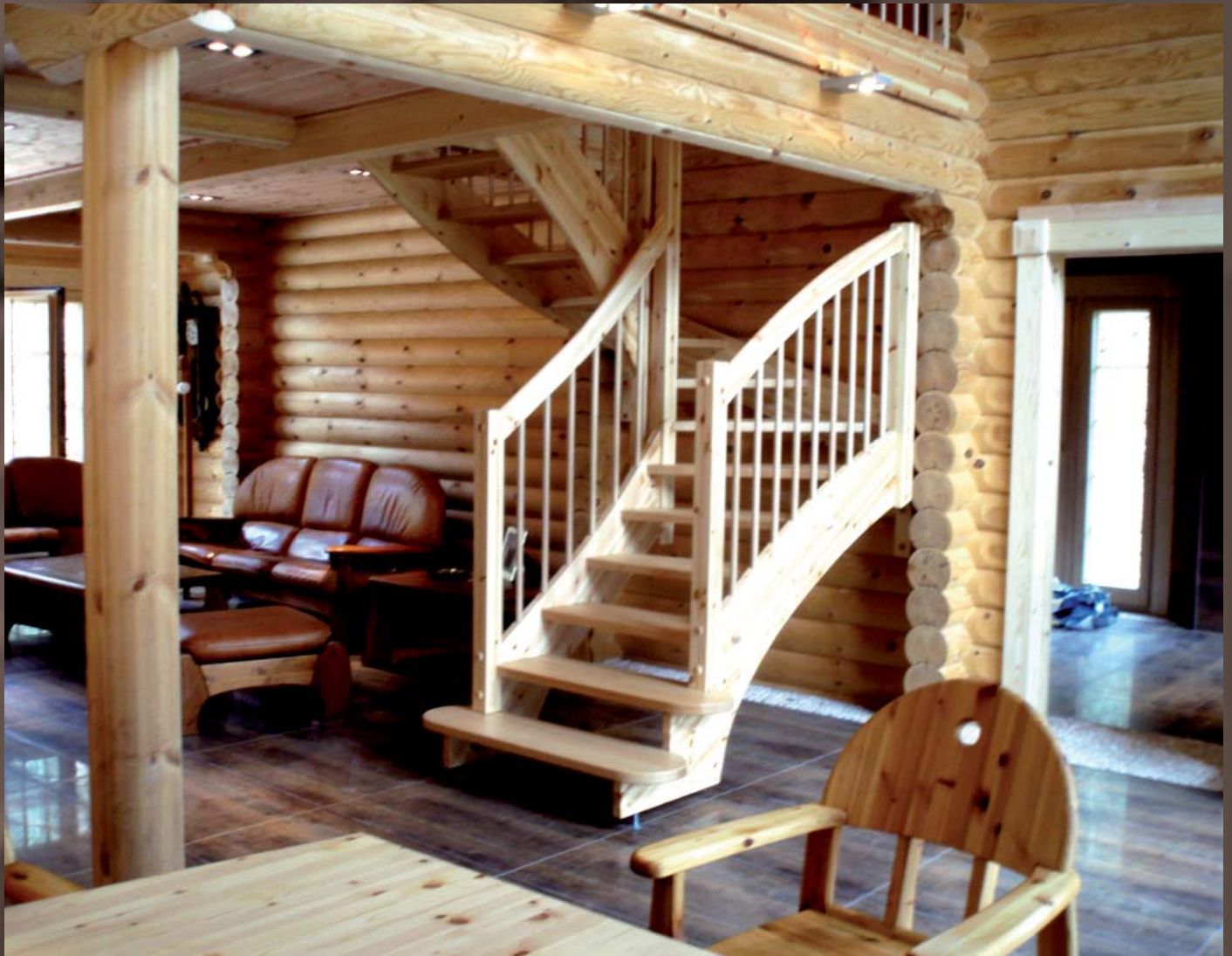
Honka-Haus Wangentreppe mit Außengeländer in Kiefer/Buche inkl. Höhenverstellung- Setzungsausgleich, Stufen mit Anti rutsch Lackierung, Empore Brüstungsgeländer Buche-Stäbe, Buche/Natur